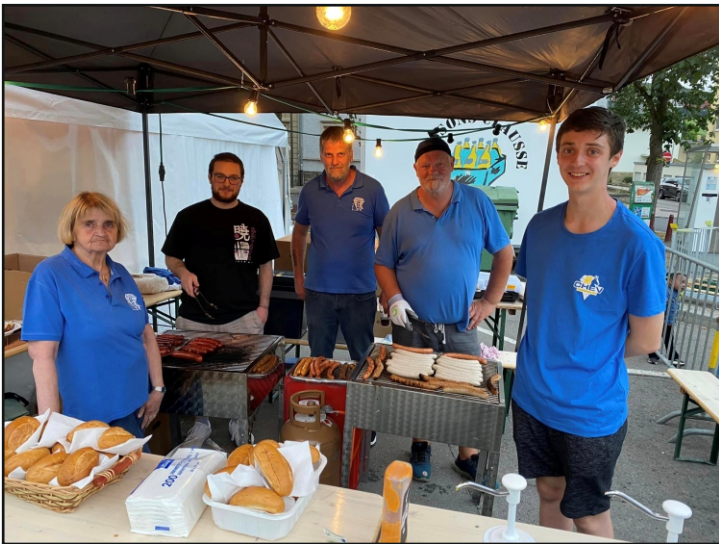
Virowend vun Nationalfeierdaag