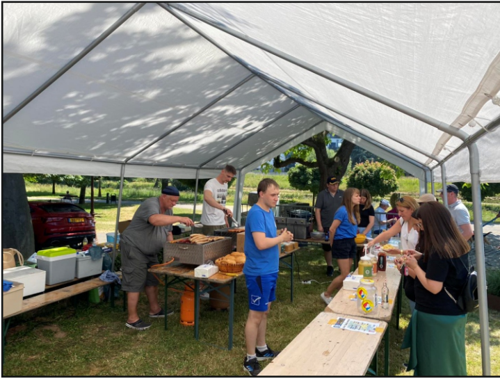
Dikrich feiert den Eesel