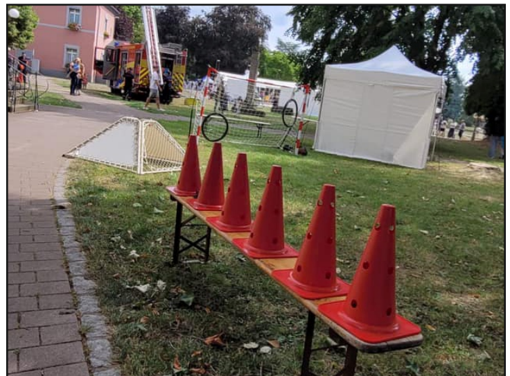
Kids' Day an Braderie